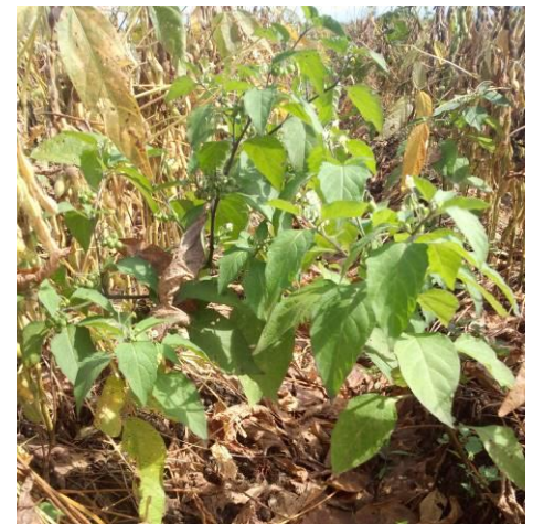
大きな雑草 (イヌホオズキ) を抜き取る