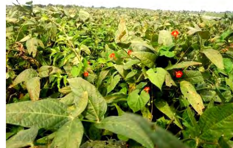
帰化アサガオ類も畦畔から侵入が見られたら、繁殖する前にしっかり抜き取りましょう。